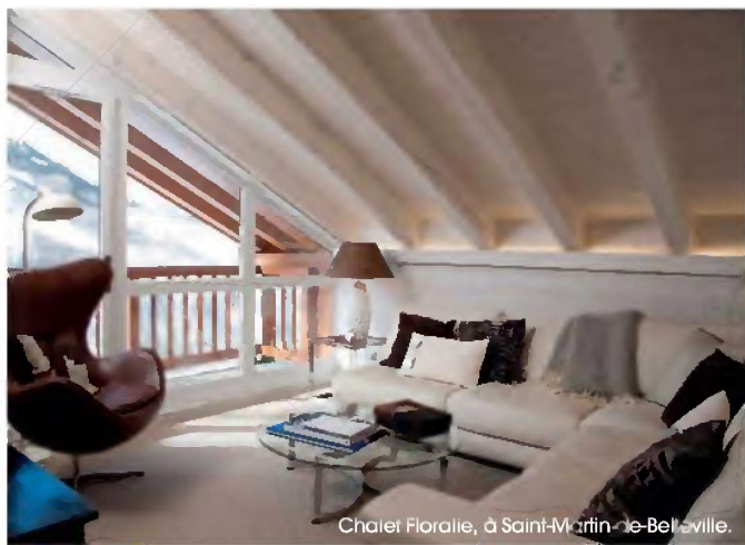
Chalet Floralie, à Saint-Martin-de-Belleville.

espace fitness, conciergerie... tout est conçu pour un confort maximum. Mélange de bois et de tissus aux couleurs toniques, le décor des chambres a des accents nordiques. Également trois restaurants, Les Enfants Terribles (brasserie chic version montagne), La Laiterie (restaurant traditionnel savoyard) et Le Deux Mille. A. W.