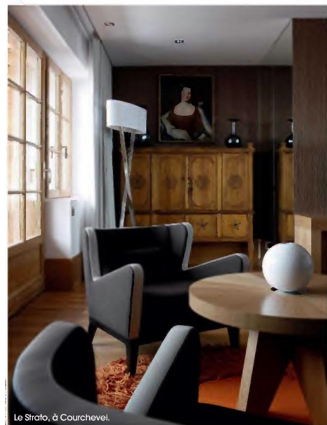
Le Strato, à Courchevel.