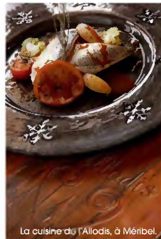
La cuisine de l'Allodis, à Méribel.