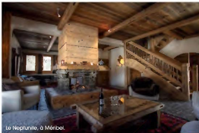
Le Neptunite, à Méribel.

AEC Collection. Tél. 0450882185 et aec-collection.com