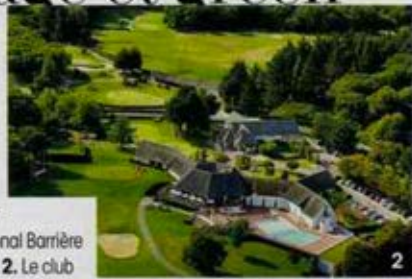
1. Le golf international Barrière La Baule. 2. Le club house. 3. L'hôtel L'Hermitage.